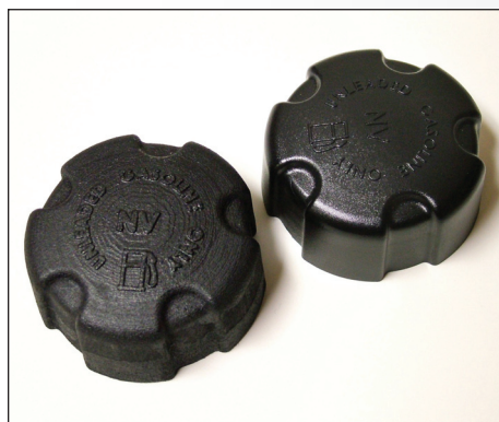
Tapón de depósito de combustible y prototipo impreso con la ZPrinter 310 Plus

— ANDY JOHNSON DISEÑADOR INDUSTRIAL POWERMATE